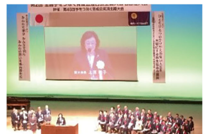
育成会連合会全国大会