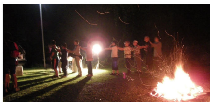
親子療育キャンプ